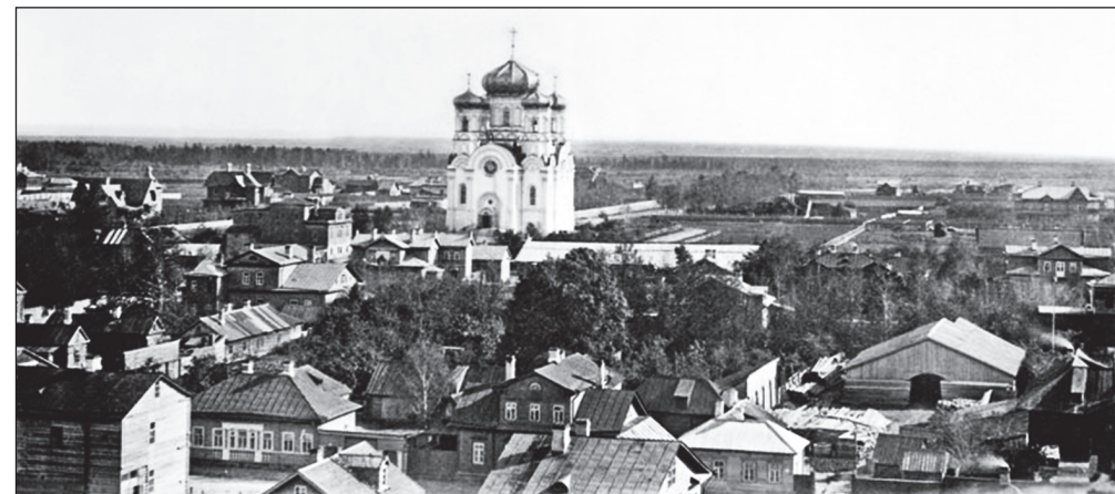
Гатчино. Вид Павловского собора. Фото начала XX века.